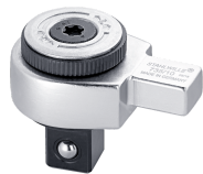
58250010 Feinzahn- Einsteckknarre