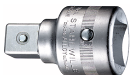
16030005 Parte transitoria