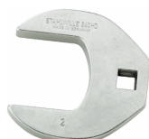
03501076 Crowfoot-Schlüssel heavy-duty