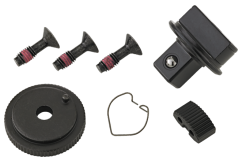
59251020 Knarren-Ersatzteil- Satz