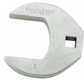
03501064 Crowfoot-Schlüssel heavy-duty