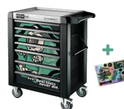
81200175 Werkstattwagen Sonderedition Best tools never die