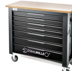
85010625 Mobile Werkbank