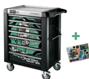
81200175 Werkstattwagen Sonderedition Best tools never die