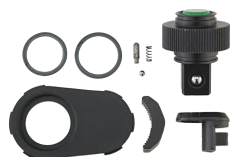
19021020 Knarren-Ersatzteil- Satz