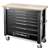
85010625 Mobile Werkbank