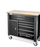
85010621 Mobile Werkbank