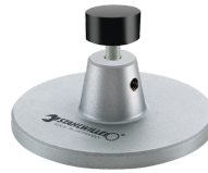
52110162 Opzet v. dockingstation nr.7762