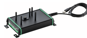
52110062 Estación de acoplamiento