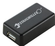
52110061 Adaptador de interfaz