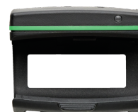
52110220 Módulo Bluetooth Low Energy 714