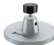
52110162 Opzet v. dockingstation nr.7762