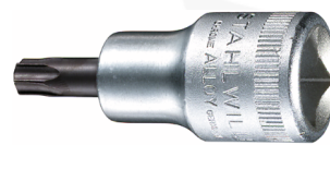
03100060 Douille pour tournevis