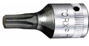
01350009 Douille pour tournevis