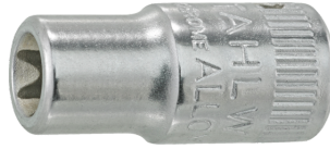
01270005 Douille pour tournevis