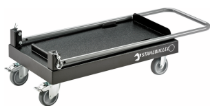
81091009 Chariot pour caisse à outils