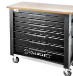
85010625 Mobil arbeidsbenk