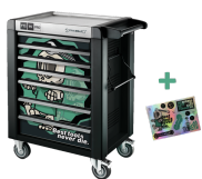
81200175 Verkstedvogn spesialutgave Best tools never die