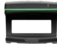
52110220 Bluetooth Low Energy module 714