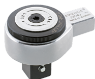
58250040 Cricco a innesto con dentatura fine