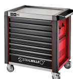
81200174 Carrello da officina