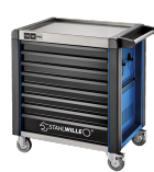
81200173 Carrello da officina