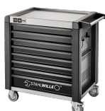
81200172 Carrello da officina