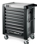
81200166 Carrello da officina