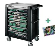
81200175 Verkstadsvagn specialutgåva Best tools never die