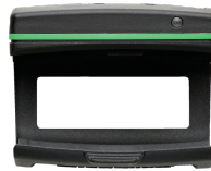
52110220 Bluetooth Low Energy module 714