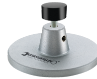
52110162 Opzet v. dockingstation nr.7762