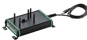
52110062 Estación de acoplamiento