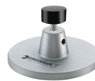
52110162 Estación de acoplamiento n.º 7762