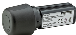
54101195 Batería de iones de litio