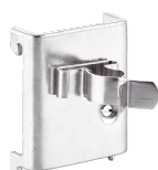
81485006 Pinza de resorte