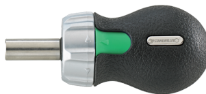
18120002 Destornillador de carraca con punta