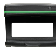
52110220 Module Bluetooth Low Energy 714