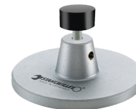
52110162 Wsparcie dla stacji dokującej nr 7762