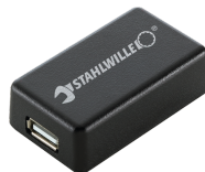
52110061 Adapter interfejsu