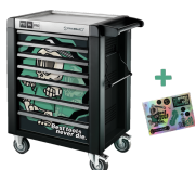
81200175 Carrello da officina edizione speciale Best tools never die