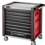
81200174 Carrello da officina