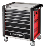
81200171 Carrello da officina