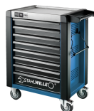
81200167 Carrello da officina