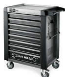
81200166 Carrello da officina