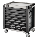
81200172 Carrello da officina