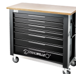
85010625 Banco da lavoro mobile