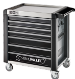
81200169 Carrello da officina