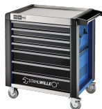
81200170 Carrello da officina