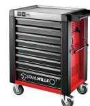
81200168 Carrello da officina