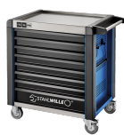
81200173 Carrello da officina