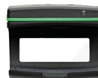
52110220 Moduł Bluetooth Low Energy 714