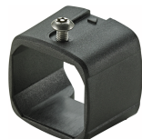
54100070 Blokada bezpieczeństwa QR