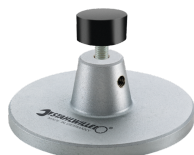
52110162 Wsparcie dla stacji dokującej nr 7762