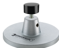
52110162 Wsparcie dla stacji dokującej nr 7762