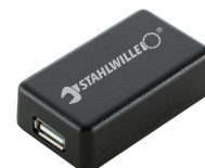
52110061 Adapter interfejsu