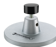
52110162 Édition pour station d'accueil réf. 7762