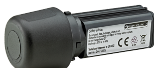
54101195 Batería de iones de litio