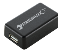
52110061 Adaptador de interfaz