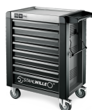
81200166 Carrello da officina