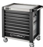
81200172 Carrello da officina