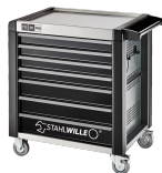
81200169 Carrello da officina