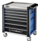
81200170 Carrello da officina