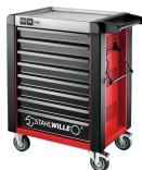
81200168 Carrello da officina