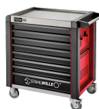
81200174 Carrello da officina