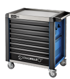
81200173 Carrello da officina