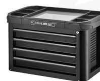
81200157 Cassettiera Convertibile