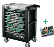
81200175 Carrello da officina edizione speciale Best tools never die