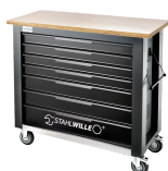
85010625 Banco da lavoro mobile