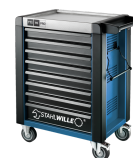
81200167 Carrello da officina