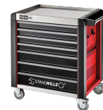
81200171 Carrello da officina