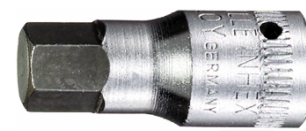
01120004 Punta para destornilladores INHEX