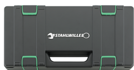
81271013 Cajas de juegos