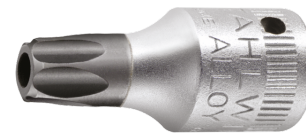
01351020 Punta para destornilladores