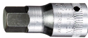
01120005 Punta para destornilladores INHEX