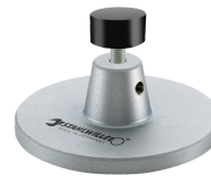
52110162 Opzet v. dockingstation nr.7762