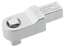
58243012 Kalibratie- insteekvierkant