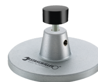
52110162 Wsparcie dla stacji dokującej nr 7762