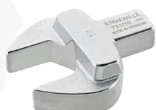
58211017 Herramienta de inserción de boca