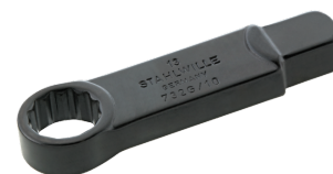
58620009 Herramienta de inserción con anillo