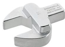
58611020 Herramienta de inserción de boca