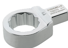
58221017 Herramienta de inserción con anillo