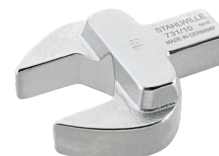
58211007 Herramienta de inserción de boca