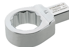
58221021 Herramienta de inserción con anillo