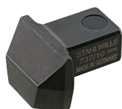
58270010 Herramienta de inserción para soldar