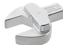
58611028 Herramienta de inserción de boca