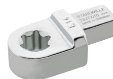
58291012 Herramienta de inserción TORX