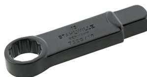
58620008 Herramienta de inserción con anillo