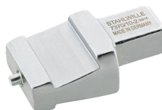
58290012 Adaptador insertable