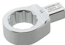
58221008 Herramienta de inserción con anillo