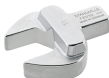
58211010 Herramienta de inserción de boca