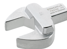
58611040 Herramienta de inserción de boca