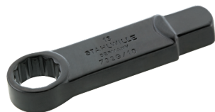
58620013 Herramienta de inserción con anillo