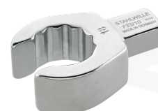
58231016 Herramienta de inserción OPEN-RING