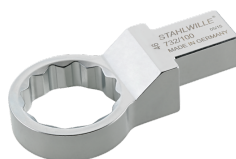
58621042 Herramienta de inserción con anillo