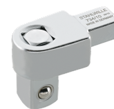
58240010 Herramienta inserción cuadrangular