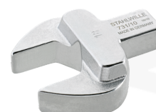
58211016 Herramienta de inserción de boca