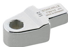
58262610 Herramienta de inserción de soporte de puntas