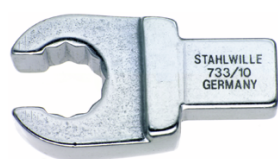
58231012 Herramienta de inserción OPEN-RING