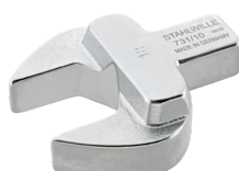
58211019 Herramienta de inserción de boca