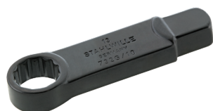
58621224 Herramienta de inserción con anillo