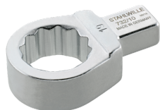
58221019 Herramienta de inserción con anillo