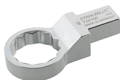
58621038 Herramienta de inserción con anillo