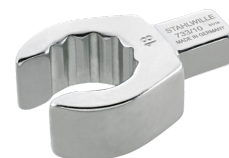
58631028 Herramienta de inserción OPEN-RING