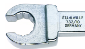
58231011 Herramienta de inserción OPEN-RING