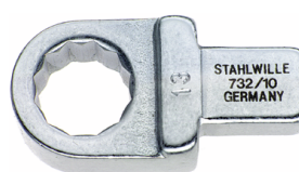
58221013 Herramienta de inserción con anillo