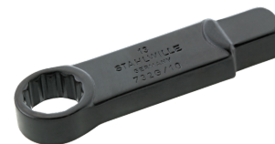
58621216 Herramienta de inserción con anillo