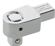
58241005 Herramienta inserción cuadrangular