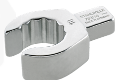
58231017 Herramienta de inserción OPEN-RING