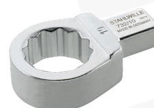
58221014 Herramienta de inserción con anillo