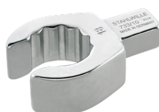
58231019 Herramienta de inserción OPEN-RING