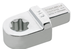
58291014 Herramienta de inserción TORX