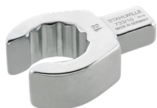
58231022 Herramienta de inserción OPEN-RING