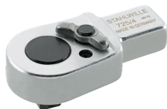
58254004 Carraca de inserción