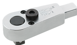
58151005 Carraca de inserción