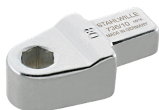
58261010 Herramienta de inserción de soporte de puntas