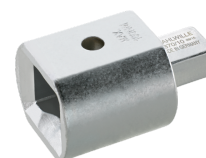
58290010 Adaptador insertable