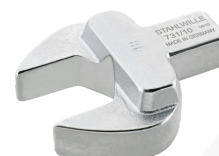
58211012 Herramienta de inserción de boca