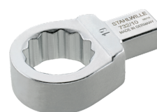
58221018 Herramienta de inserción con anillo