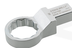
58621044 Herramienta de inserción con anillo