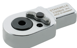
58255005 Punta de carraca de inserción