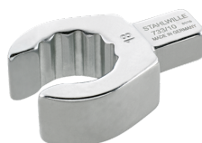
58231010 Herramienta de inserción OPEN-RING