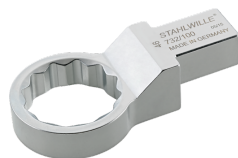
58621020 Herramienta de inserción con anillo