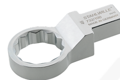
58621036 Herramienta de inserción con anillo