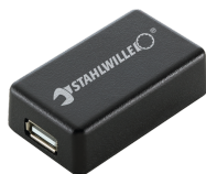
52110061 Adaptateur d'interface