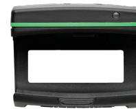
52110220 Bluetooth Low Energy module 714