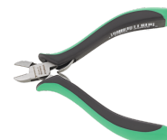
67086000 Mini-Elektronik- Seitenschneider