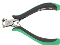
67096000 Elektronik- Vornschneider