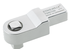
58243012 Końcówka wtykowa czworokątna do kalibracji