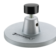
52110162 Opzet v. dockingstation nr.7762