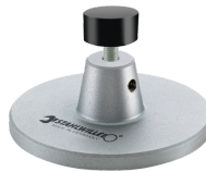
52110162 Opzet v. dockingstation nr.7762