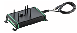
52110062 Docking station