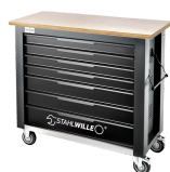
85010625 Mobil arbeidsbenk