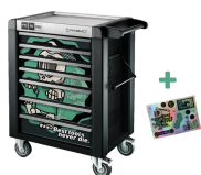
81200175 Verkstedvogn spesialutgave Best tools never die