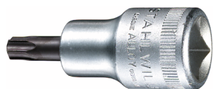
03100050 Punta para destornilladores