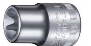
03270016 Juego de bocas de llaves de vaso