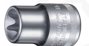
03270020 Juego de bocas de llaves de vaso