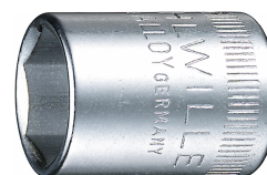
01010008 Wkładka do kluczy nasadowych