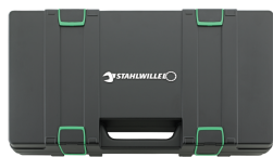
81271019 Skrzynka narzędziowa