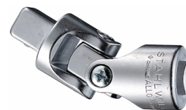
13020000 Przegub cardana