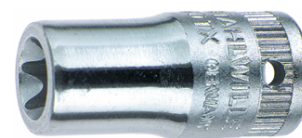
01270008 Wkładka do kluczy nasadowych