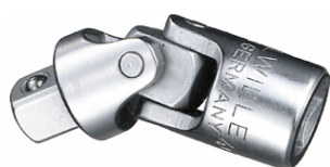
11020000 Przegub cardana