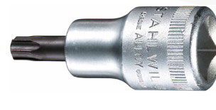
03100060 Nasadka wkrętakowa