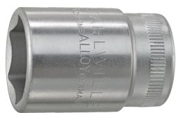
03030019 Wkładka do kluczy nasadowych