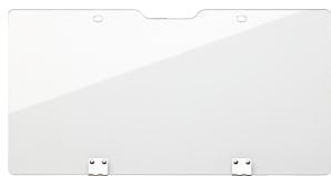
89010100 Gjennomsiktig deksel