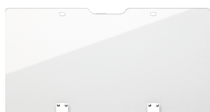
89010100 Gjennomsiktig deksel