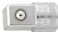
11030003 Douille à choc