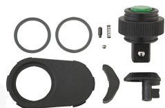
19012020 Jeu de pièces détachées pour cliquet