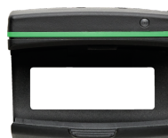
52110220 Moduł Bluetooth Low Energy 714