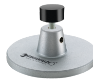
52110162 Opzet v. dockingstation nr.7762