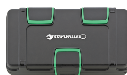
81251019 Cajas de juegos