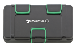
81251019 Cajas de juegos