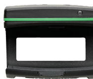
52110220 Bluetooth Low Energy module 714